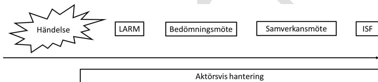
Figur 5. Principer för samverkansformer

ISF möte syftar till att träffa överenskommelser mellan berörda aktörer kring inriktning och samordning för hantering av händelsen, då händelsen behöver samordnas inom länet. Kan med fördel genomföras enligt principerna för inriktnings- och samordningsfunktion som är mer beskriva i Gemensamma grunder för samverkan och ledning vid samhällsstörningar (MSB, 2015). Deltagande aktörer förväntas delta med representanter som har beslutsmandat för egen organisation.