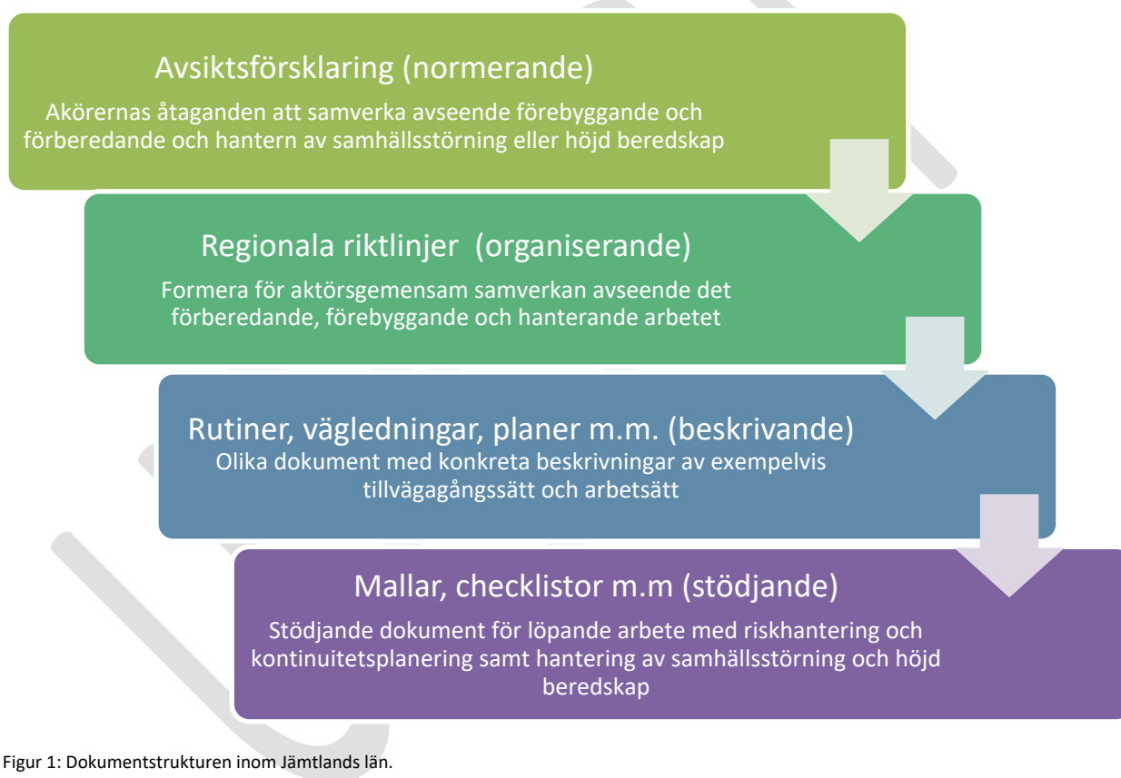
Figur 1: Dokumentstrukturen inom Jämtlands län.

Till de regionala riktlinjerna finns rutiner, vägledningar och planer och andra dokument som konkret beskriver tillvägagångssätt och arbetssätt. Som stöd för det konkreta arbetet finns mallar, checklistor och annat material. Dessa arbetas fram utefter det behov som uppstår.