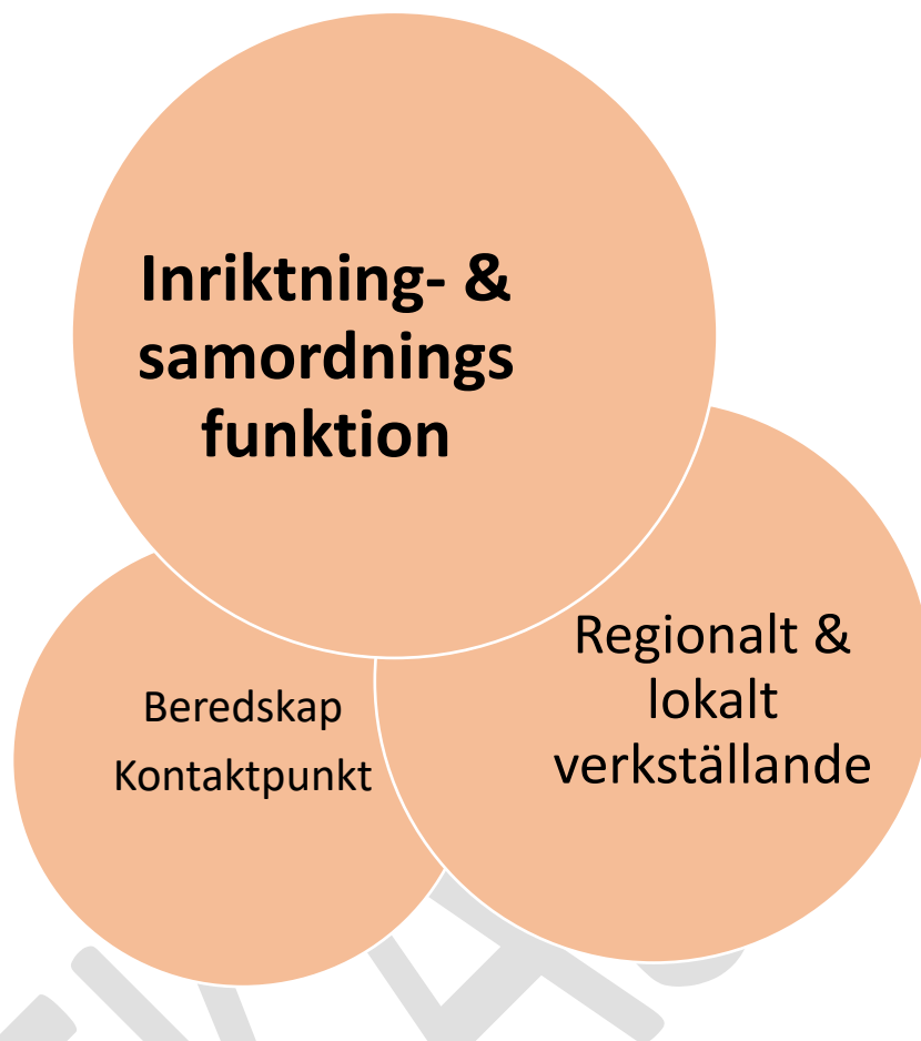
Figur 4. Samverkansnivåer för hela hotskalan